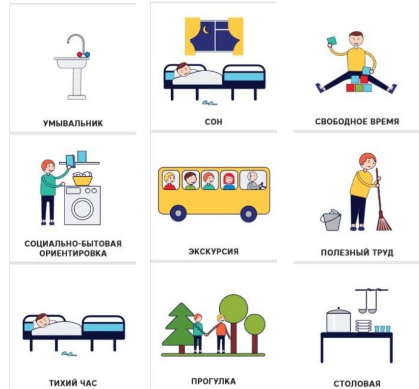
Пример карточек для визуального расписания

На основании работы по коррекции поведения воспитанников средствами АДК были разработаны визуальные расписания и карточки для маркировки помещений в ДДИ